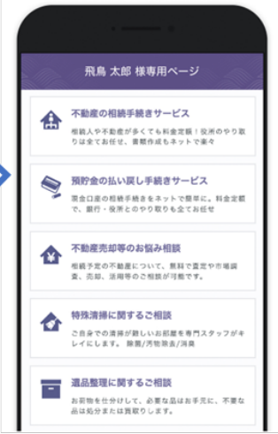
tsunago (つなぐ) 「ご遺族ページ」 ※画面はイメージです。