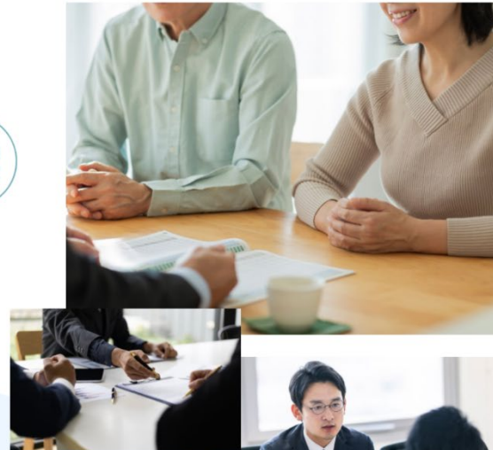
tsunago(つなぐ)からの弊社遷移ページ